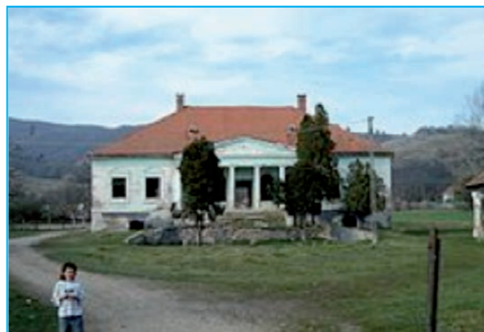
Villa du Général dans le village qui porte son nom.

De 1923 à 1926, il est Gouverneur Militaire de Strasbourg.