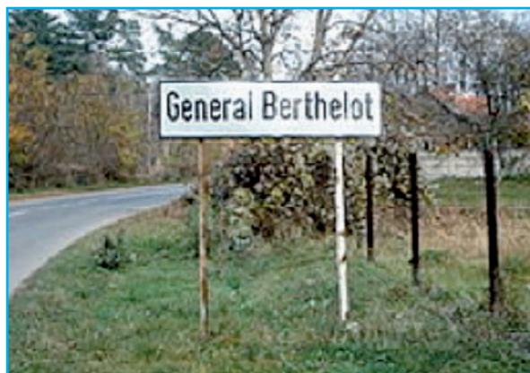
L'entrée du village "Général Berthelot" en Roumanie.

Aujourd'hui de nombreux établissements scolaires, rues, boulevards,... portent son nom en Roumanie.