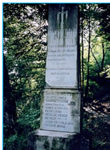
Un Monument aux Morts de l'Armée Berthelot (1919) dans la commune de Lipova.

En 1923 en signe de reconnaissance de la contribution de l'Armée Française à la libération de la Roumanie, il reçoit du Roi Ferdinand I er et de la Reine Marie de Roumanie une propriété confisquée à la famille Nopcsa, aristocrates austro-hongrois, située dans le village transylvain de Farcadin, ainsi qu'une palme de reconnaissance conservée dans l'église du village. L'acte de cession inclut un manoir ainsi que 70 hectares de terrain agricole, un verger et de la forêt, dont les