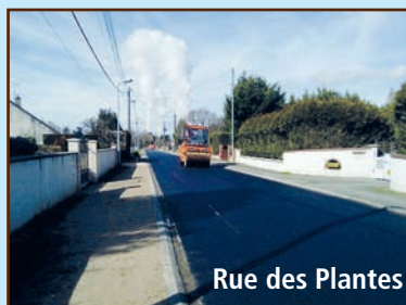
Rue des Plantes

La rénovation de sa chaussée y a été opérée. Les travaux financés par la communauté de communes (70 000€) sont ainsi en accord avec les priorités du plan pluriannuel intercommunal.