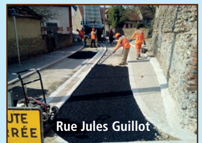
Rue Jules Guillot

La commune poursuit la rénovation du centre bourg avec la réfection de la rue Jules Guillot, charmante venelle s'il en est, un des attraits de notre village. Financés par la Communauté de Communes, (60 000€) dans le cadre de la 3 e opération Cœur de Village et réalisés par l'entreprise Meunier de Nogent-sur-Vernisson les travaux sont désormais achevés. A noter que la circulation à double sens y est maintenue.