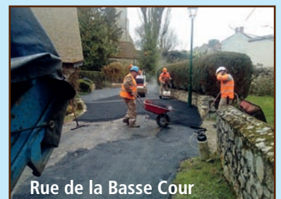
Rue de la Basse Cour

Vous vous en souvenez sûrement, en 2016, l'Aquiaulne est sortie de son lit emportant le revêtement de la rue de la Basse-Cour. Elle a été remise en état grâce à des subventions régionales et départementales pour 10 000€.